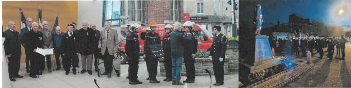
30 Novembre Ste Cécile-Ste Barbe