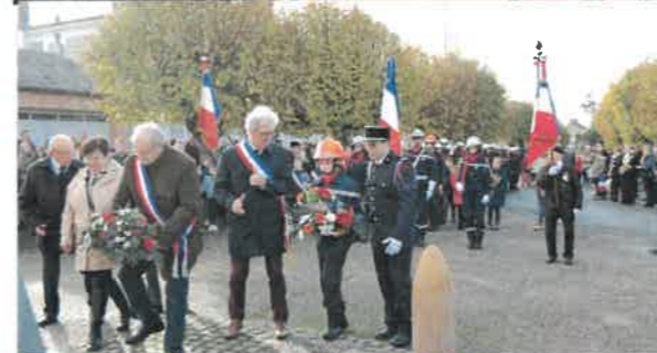
11 Novembre Commémoration de l'Armistice