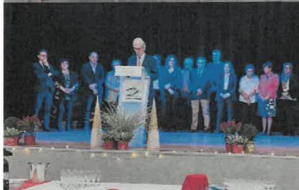
4 janvier Vœux du Maire