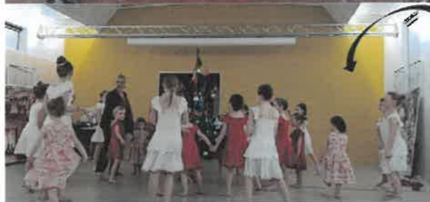
8 Décembre Le Club Vive la vie à Dieppe