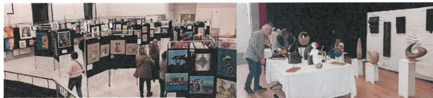
9 au 11 Novembre Exposition Criq'Couleur