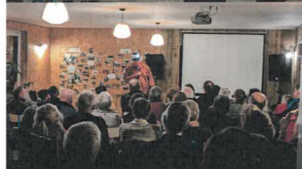
14 Novembre À l'Asso Étable Film et échanges « La ferme à Gégé »